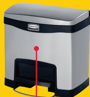
SLIM JIM STEP ON CONTAINERS

FÜR WEITERE INFORMATIONEN ÜBER UNSERE WICHTIGEN HYGIENE-, REINIGUNGS- UND ABFALLPRODUKTE